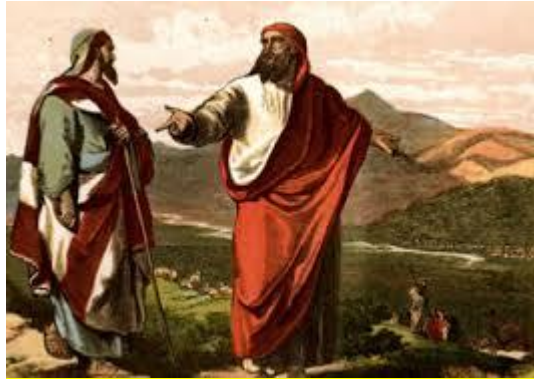
WAT KIEST LOT?

[Bron]: Astrophysik: https://www.sueddeutsche.de/wissen/astrophysik-wasser-auf-der-erde-soll-aelter-als-die-sonne-sein-1.2146225 oder http://www.spiegel.de/wissenschaft/weltall/grossteil-des-wassers-auf-der-erde-ist-aelter-als-die-sonne-a-993982.html