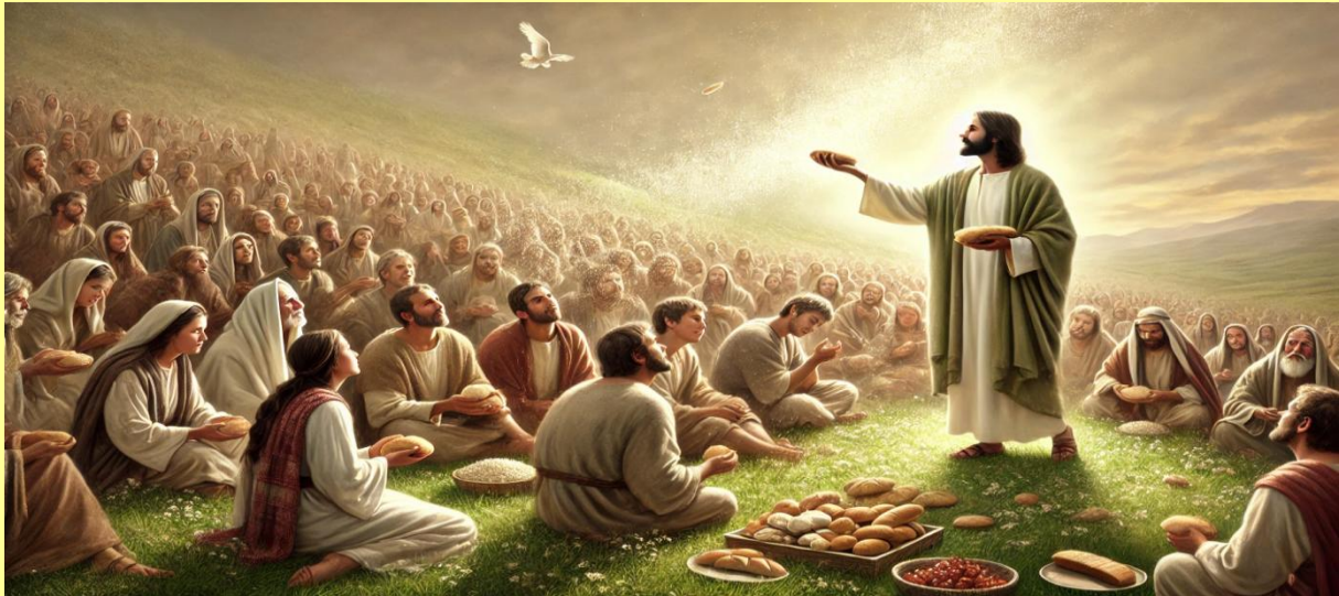
De spijziging van 5 gerstebroden en 2 vissen

"De handeling op zichzelf, waarbij Ik ervoor zorgde dat uit de stoffen van de lucht de vijf gerstebroden en de twee vissen zich telkens vermenigvuldigden..."