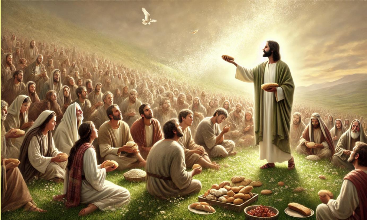
La multiplication des 5 pains d'orge et des 2 poissons