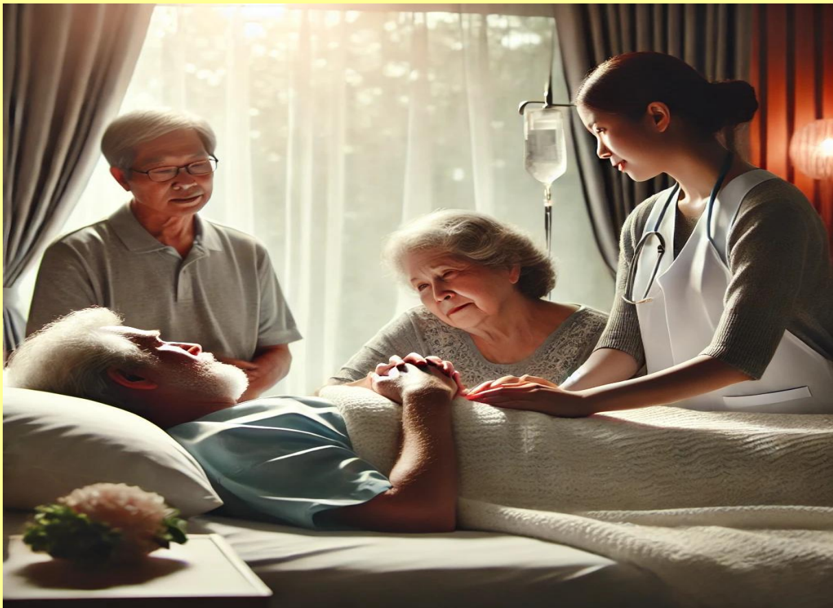
Begaand met een stervend mens

Ondertussen werden de bevindingen van Kübler-Ross door vele andere wetenschappers uitgebouwd en aangevuld. Volledigheidshalve kunnen er in feite 7 stadia in het stervensproces onderkend worden. Deze 7 stadia komen overeen met andere processen zoals we die in natuur op talrijke manieren kunnen zien als 7-delige ontwikkelingen. Het zou ons te ver afleiden om hier de 7-delige natuurverschijnselen te willen tonen, maar wie zich enigszins wil informeren, stuit hoe dan ook op de 7-delige wetmatigheid.