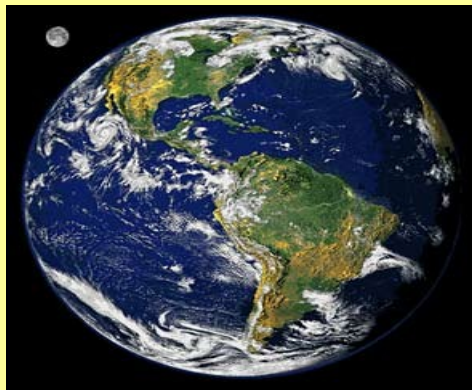
De aarde: twee imaginaire dieren die als het ware tegenover elkaar staan

Zoals gezegd is de maan gedoemd om de aarde te blijven volgen. Zij is meer dood dan leven en haar straling is voor de mens niet bevorderlijk, maar zij is weldadig voor de natuur. Omdat de maan meer een lijk is, doet haar inwerking op de aarde vooral dienst bij kerkhoven. Het gras en de planten die daar omheen groeien, zijn opvallend sappig en welig.