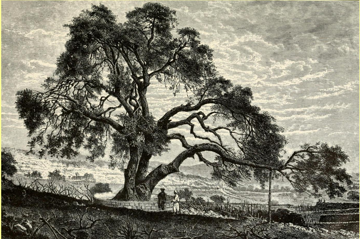
Abram vestigde zich bij de terebintbomen van Mamre, ongeveer twee mijl ten noorden van Hebron (Gen.13:18)

HIJ werd voorafgebeeld door de ram die in de doornen hing. God zei ook dat het geslacht van deze Abraham vermenigvuldigd moest worden volgens de sterren van de hemel. Want in dit geslacht voorzag hij wat zou worden opgenomen in het volle getal van de hemelse gemeenschap. En omdat die [Abraham] God in alles trouw geloofde, werd hij ook de vader genoemd van hen die erfgenamen zouden zijn van het koninkrijk der hemelen. (Bron: Het Boek der Goddelijke Werken - Liber Divinorum Operum - H.v.Bingen).