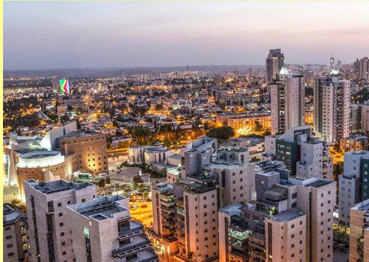
Het huidige Bersheba bij Mamron waar Abraham woonde in zijn tenten