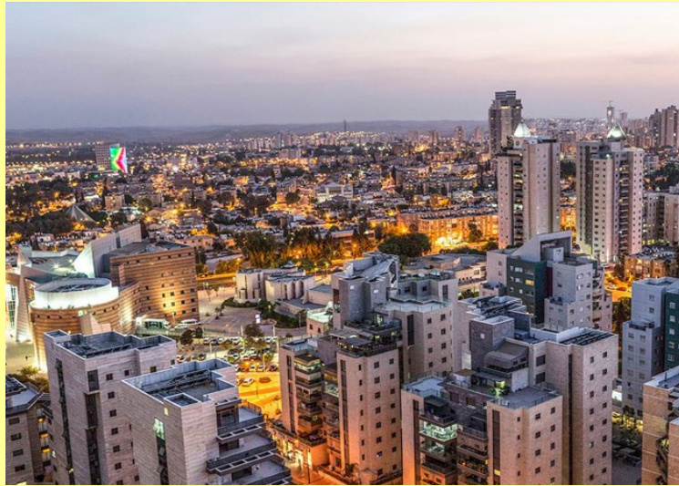
L'actuelle Bersheba en Israël

Depuis, Abraham leva les yeux et vit un bélier dont les cornes s'étaient prises dans un buisson. Abraham alla donc prendre le bélier et l'offrit en holocauste à la place de son fils. Puis Abraham retourna vers ses serviteurs, et ils se levèrent et partirent ensemble pour Bersabée; et Abraham resta à Bersabée. (Genèse 22,1-19). 6