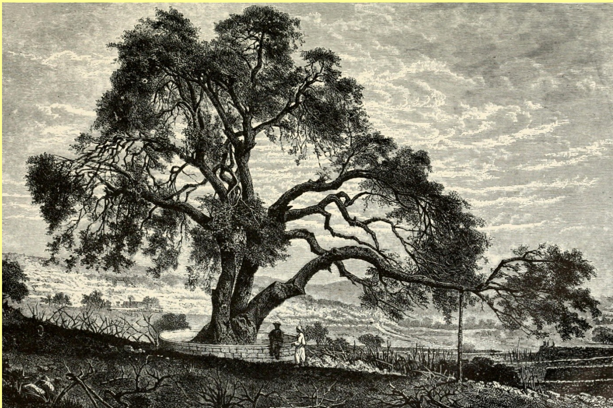
Abram s'est installé près des térébinthes de Mamré, à environ deux miles au nord d'Hébron (Gen. 13:18).

L'obéissance d'Abraham, par laquelle Dieu éprouva sa foi en lui montrant le bélier suspendu dans les épines, signifie aussi l'obéissance de la bienheureuse Vierge à l'avance. Elle a cru à la parole du messenger de Dieu et a voulu qu'il lui soit fait selon la parole du même messenger. C'est pourquoi le Fils de Dieu s'est revêtu de sa chair. (NB: Marie de Joseph!)