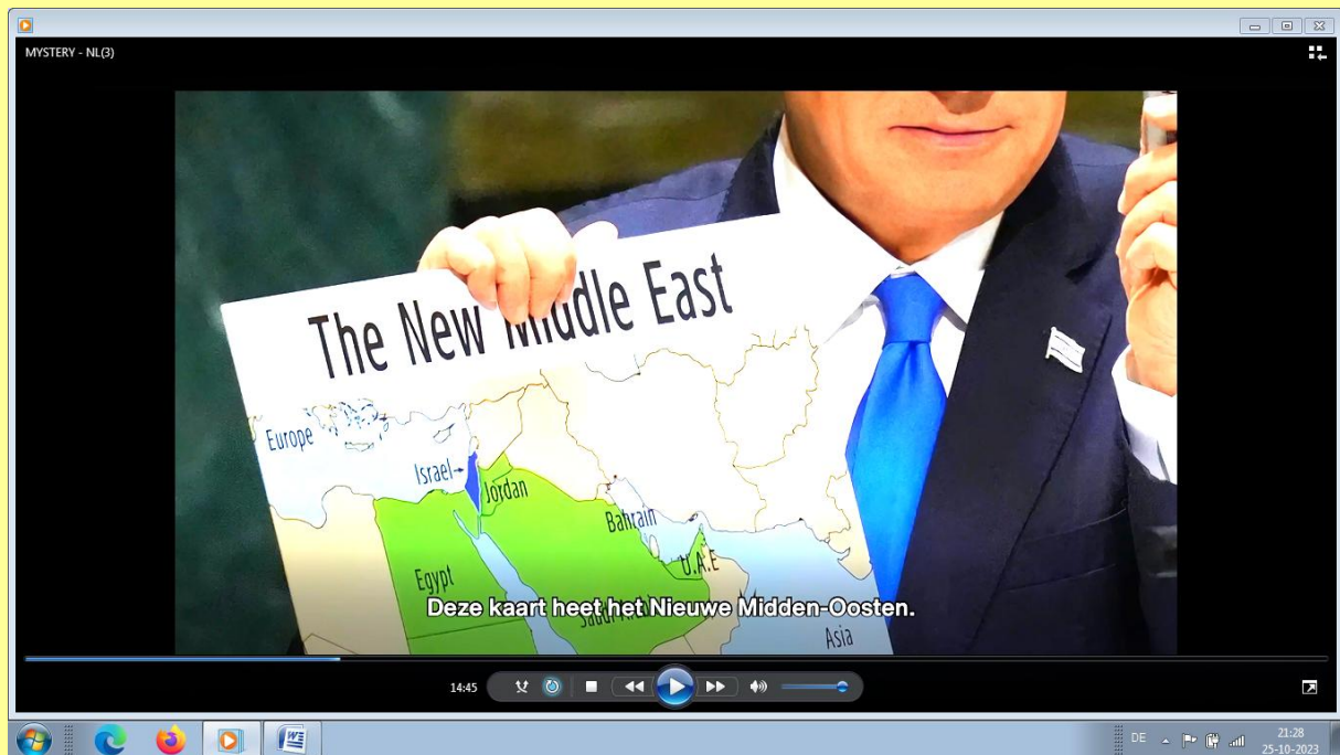
Benjamin Netanjahu zeigt hier die neue Landkarte Israels, das war vor dem 7. Oktober

Es gibt viele Missverständnisse darüber, wenn man die Begriffe 'Jude', 'Israelit' oder 'Nachkomme Abrahams' verwendet. Abraham war ein reiner, aufrechter Mann. Er war nicht gerissen und hat sich nicht auf okkulte Praktiken eingelassen. Er blieb seinem Schöpfer treu. Deshalb sagte der Herr zu ihm: 'Du wirst ein Vater für alle Völker der Geschichte sein. Aus dir wird ein großes Volk hervorgehen, das aus allen Völkern der Welt stammen wird und Israel heißen wird.'