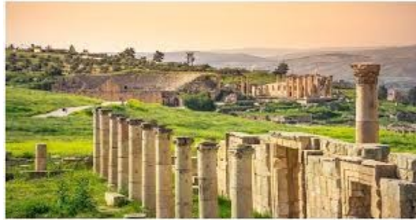
De overjordaanse stad Pella

Moderne geschiedkundigen weten het goddelijke bevel om naar Pella uit te wijken moeilijk te plaatsen, zij twijfelden sterk aan de juistheid van Eusebius' berichtgeving. Pella behoorde tot de federatie van Griekse steden, die bekend was als de Decapolis en lag ongeveer 100 km. ten N.O. van Jeruzalem. Die streek werd voornamelijk door Grieken en Romeinen bewoond. Hoe konden nu de christenen van Jeruzalem naar die heidense stad uitwijken, die bovendien op zo'n grote afstand lag?