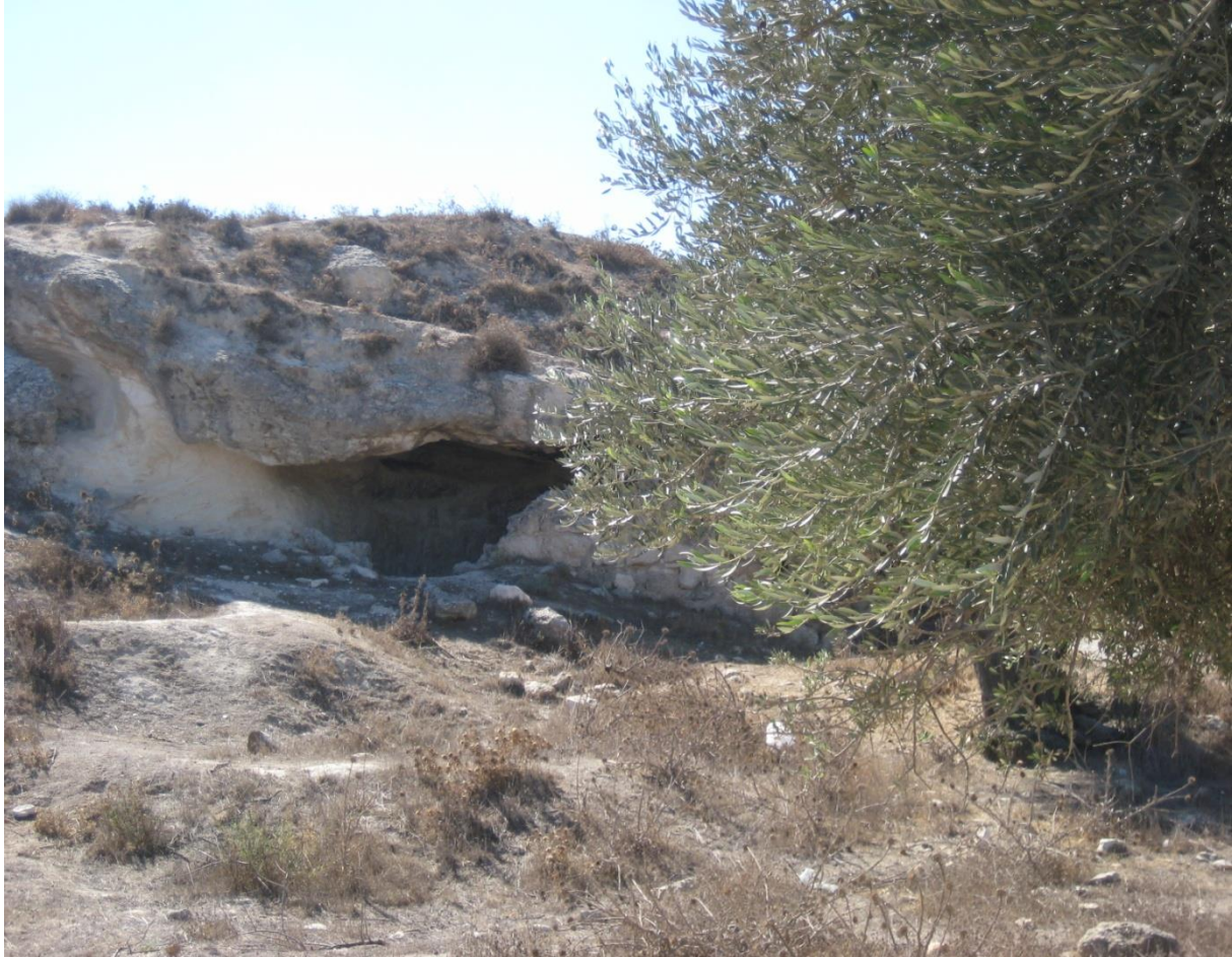
voormalig geboortegrot van Jezus

"ZIE, IK BEN BIJ JULLIE ALLE DAGEN TOT AAN HET EINDE DER WERELD"